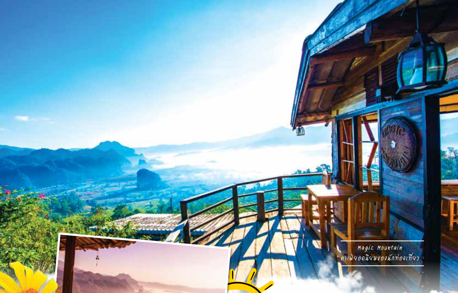
Magic Mountain คาเฟ่อดนิมของนักท่องเที่ยว