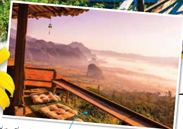
ที่พัก...ที่แอบอิงกับธรรมชาติ