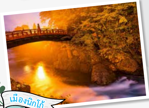
เมืองนิกโก้

ฤดูหนาวใกล้เข้ามาถึงแล้ว สำหรับท่านใดที่ยังไม่มีแผนการเดินทางไปไหน เรามีสถานที่ที่เก๋สุดฮอตในเอเชียที่พร้อมให้ทุกท่านได้สัมผัสไอหนาวท่ามกลางบรรยากาศอันแสนอบอุ่นมาฝากกัน