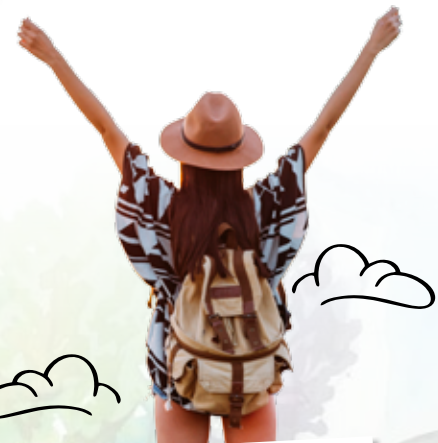
ทะเลหมอกงามแท้