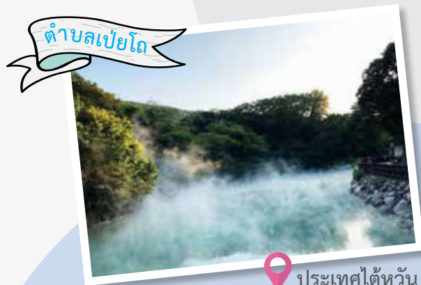
ตำบลเปย์โถ

ตั้งอยู่ทางตะวันตกเฉียงเหนือของมณฑลเสฉวน โดยภายในหุบเขาหวงหลงเป็นที่ตั้งของ "ระเบียงน้ำพุร้อนหวงหลง" ซึ่งเป็นอีกหนึ่งสถานที่ท่องเที่ยวที่มีทัศนียภาพอันงดงามอย่างยิ่งอีกแห่งหนึ่งของจีน